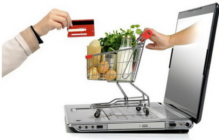
Hình minh họa.

Ngày 9/6, tại Hà Nội, Phòng Thương mại và Công nghiệp Việt Nam (VCCI) phối hợp với Trung tâm nghiên cứu dự án công nghệ (TRPC) tổ chức Diễn đàn và ra mắt báo cáo "Tiềm năng kinh tế số tại Việt Nam - Bài học từ các nước Châu Á".